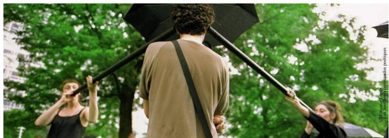
Les Souffleurs

Les Souffleurs, commandos poétiques introduiront le festival en chuchotant aux oreilles des promeneurs des secrets poétiques, philosophiques et littéraires à travers la ville.