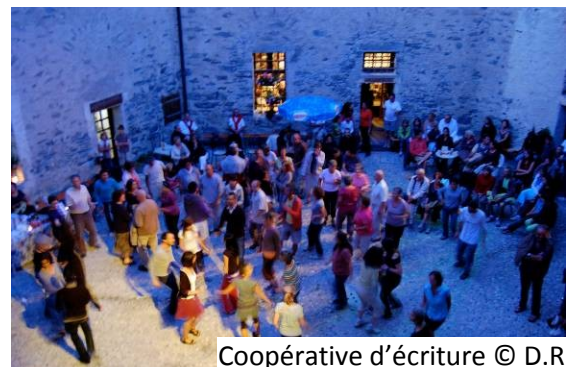
Coopérative d'écriture

Poètes, comédiens et musiciens s'empareront également du musée de Lodève pour une visite performative et poétique.